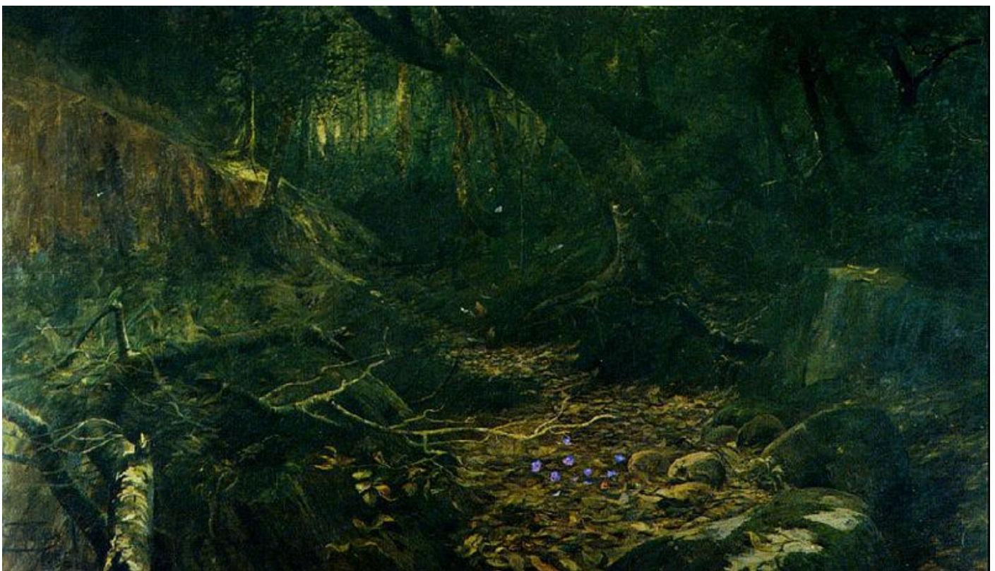
Figura 04. Antonio Parreiras. Sertanejas. 1896. Óleo sobre tela. 273 x 472 cm.