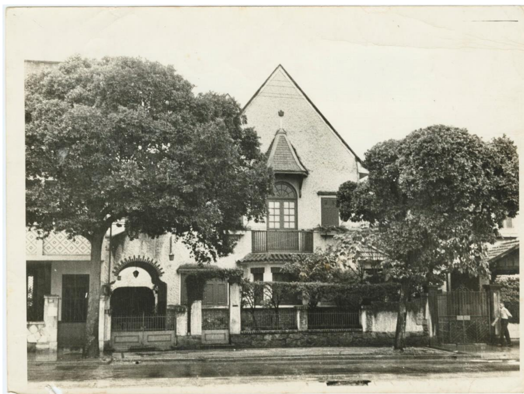
Figura 02. Lucio Costa. Casa Chambelland: Fachada. Publicado no livro "Lucio Costa: Registro de uma vivência", p. 14. A casa em estilo inglês foi o primeiro projeto do arquiteto, na Av. Paulo de Frontin, Rio de Janeiro, em 1922.